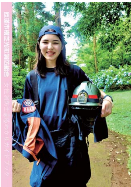
女性消防士まるわかりガイドブック