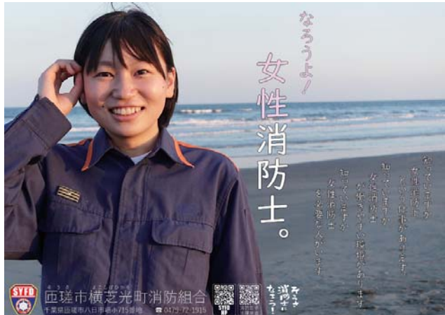
なろうよ! 女性消防士。活躍推進に向けたポスター

しかしながら、令和5年4月には、当消防組合が県内で唯一、これまでに女性消防士の採用がない状況となってしまうことから、令和5年7月の新庁舎の運用開始と併せ、当消防組合初の試みとなる「女性向け職場体験会」を開催いたしました。